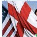
Рекламный щит шокировал жителей (фото)