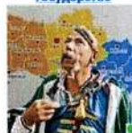
Крупный взрыв надвигается на Москву и другие крупные города России с ...