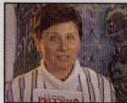
Російський уряд купує книжки для українських шкіл