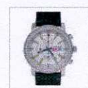
Chopard Mille 1000 Miglia #0141 170.00$ Механизм: кварцевый хронометр, хронограф 1сек/60мин, часы, минуты, секунды, дата. Корпус: диаметр 43