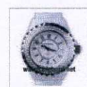
Chanel J12 #0627 370.00$ Механизм: кварцевый (ETA), часы, минуты, секунды, дата. Корпус: Керамика, диаметр 30 мм, толщ