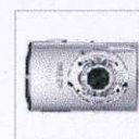
Canon Digital IXUS 860 IS Silver 340.00$ 8.20 млн. пикс., 3264x2448, Zoom 3.80x, матрица: 1/2.5", диафрагма F2.8 - F5.8, оптический стаб