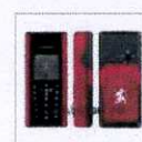
Mobiado Executive Limited Edition 900.00$ Телефон «Mobiado Professional» — это сочетание роскошного внешнего вида с прочност